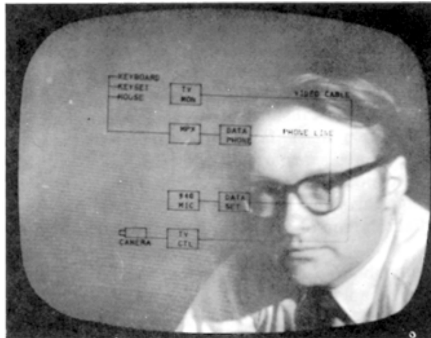
Kuva 3. Videoneuvottelu, jossa vektorigrafikkakaavio jaettiin kahden neuvotteluosapuolen kesken. Kuva miksattiin TV-kamerakuvan kanssa.

Myös näyttölaite oli edellä aikaansa. Kuva tuotettiin pienelle CRT:lle konehuoneessa ja siirrettiin analogisesti 17” TV-näytölle käyttäjän työasemalle. Nykyteknologiaa ajatellen ehkä hämmästyttävien piirre oli kuitenkin videoneuvottelumahdollisuudet (ks. kuva 3).