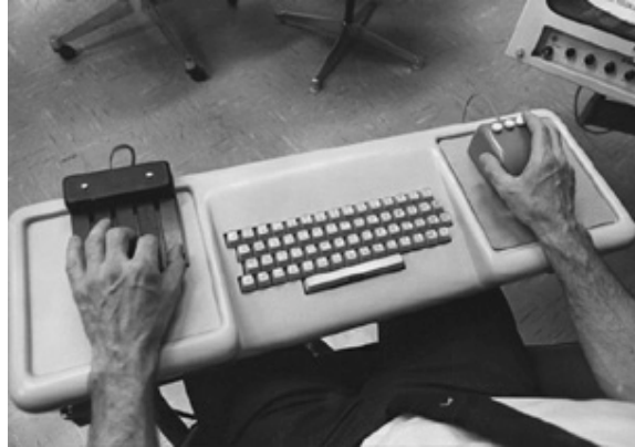
Kuva 2. NLS:n työaseman syöttölaitteet: kordiaalinäppäimistö, näppäimistö, kolminäppäinen hiiri.

Myös näyttölaite oli edellä aikaansa. Kuva tuotettiin pienelle CRT:lle konehuoneessa ja siirrettiin analogisesti 17” TV-näytölle käyttäjän työasemalle. Nykyteknologiaa ajatellen ehkä hämmästyttävien piirre oli kuitenkin videoneuvottelumahdollisuudet (ks. kuva 3).