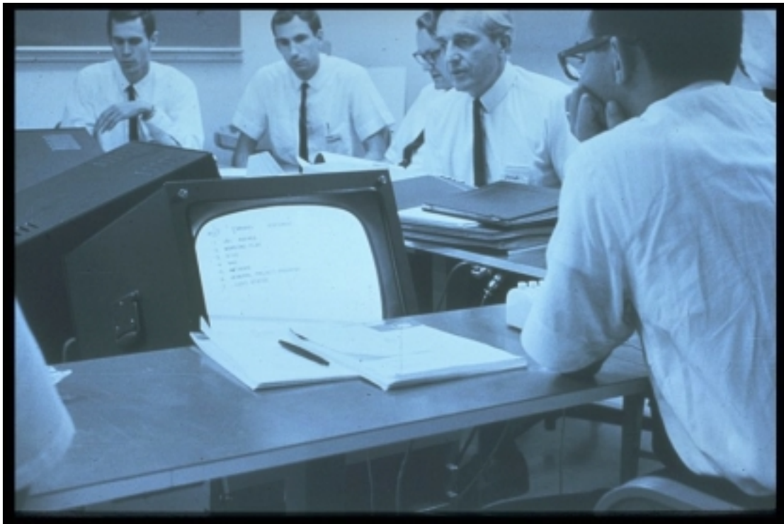
Osa Stanfordin yliopiston Augmentation Research Centerin tutkimusryhmästä 1960-luvulla. Douglas Engelbart on kuvassa toinen oikealta.

Helsinki 11. huhtikuuta 2002 Tietojenkäsittelytieteen historia -seminaari Tietojenkäsittelytieteen laitos HELSINGIN YLIOPISTO