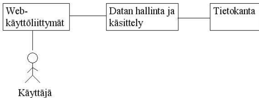
Kuva 2: Arkkitehtuurikaavio

Järjestelmän sisältämä data sijaitsee tietokannassa, jota Datan hallinta ja käsittely -osajärjestelmä käsittelee. Tietokanta toteutetaan PostgreSQL-tietokantaohjelmistolla.